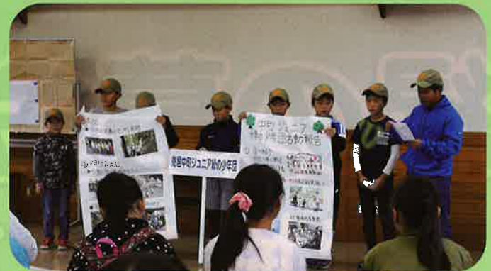
緑の少年団交流会