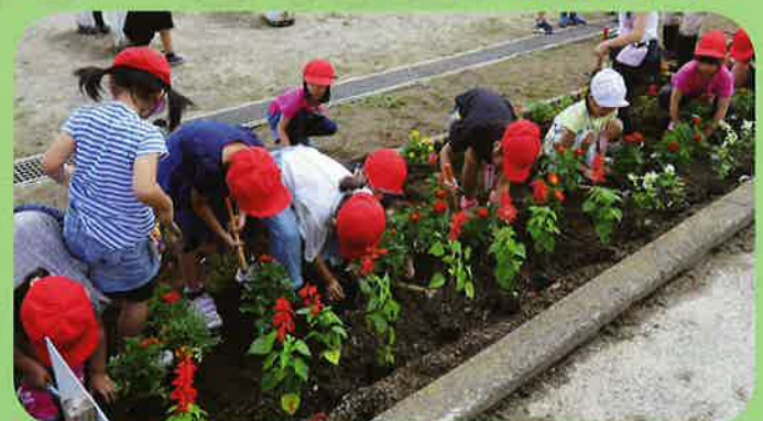
家庭募金緑化事業