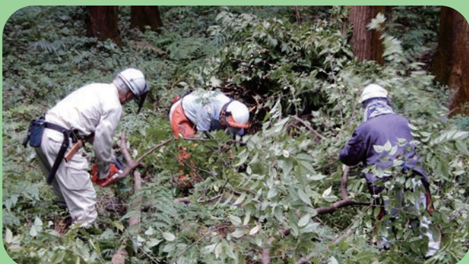
ボランティアによる整備