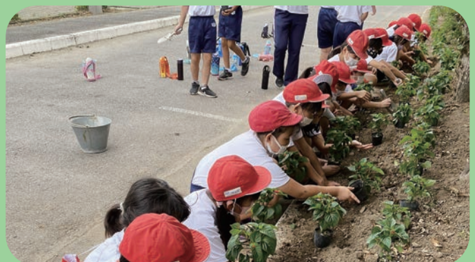
家庭募金緑化事業