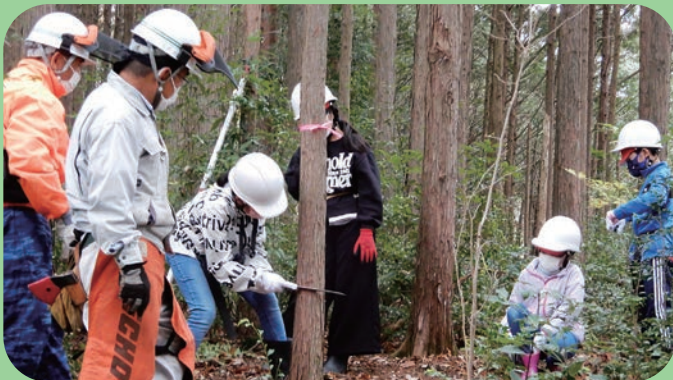
緑の少年団活動(間伐体験)