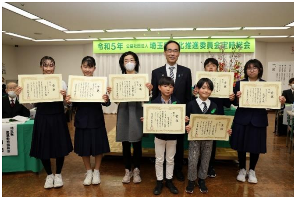
令和4年度郷土緑化運動ポスター原画コンクール