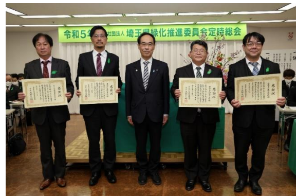
令和4年度緑の募金協力者