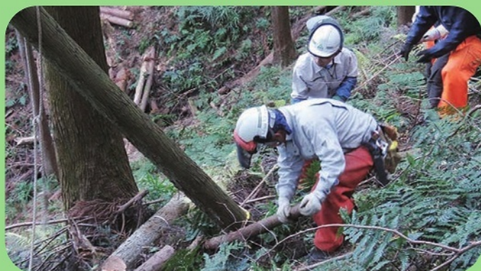
ボランティアによる整備