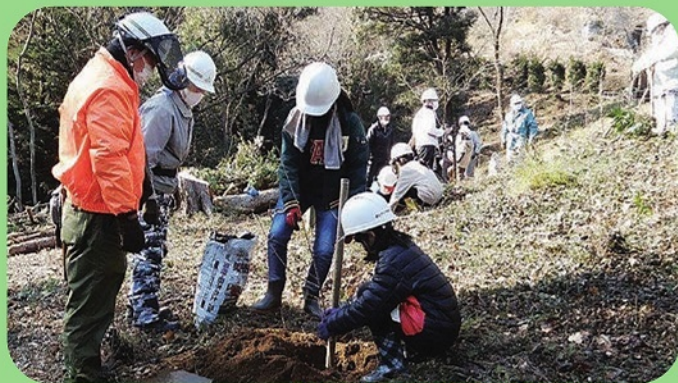
緑の少年団活動(植樹体験)