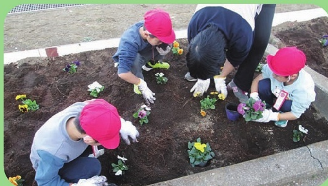
家庭募金緑化事業